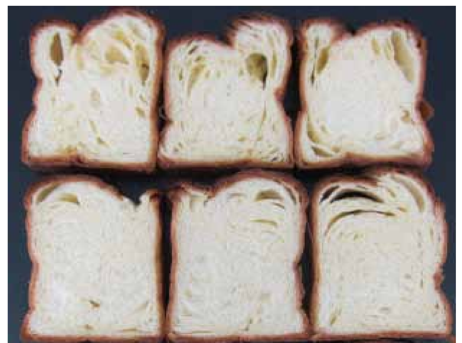
上：コントロール 下：デナビイク RICH