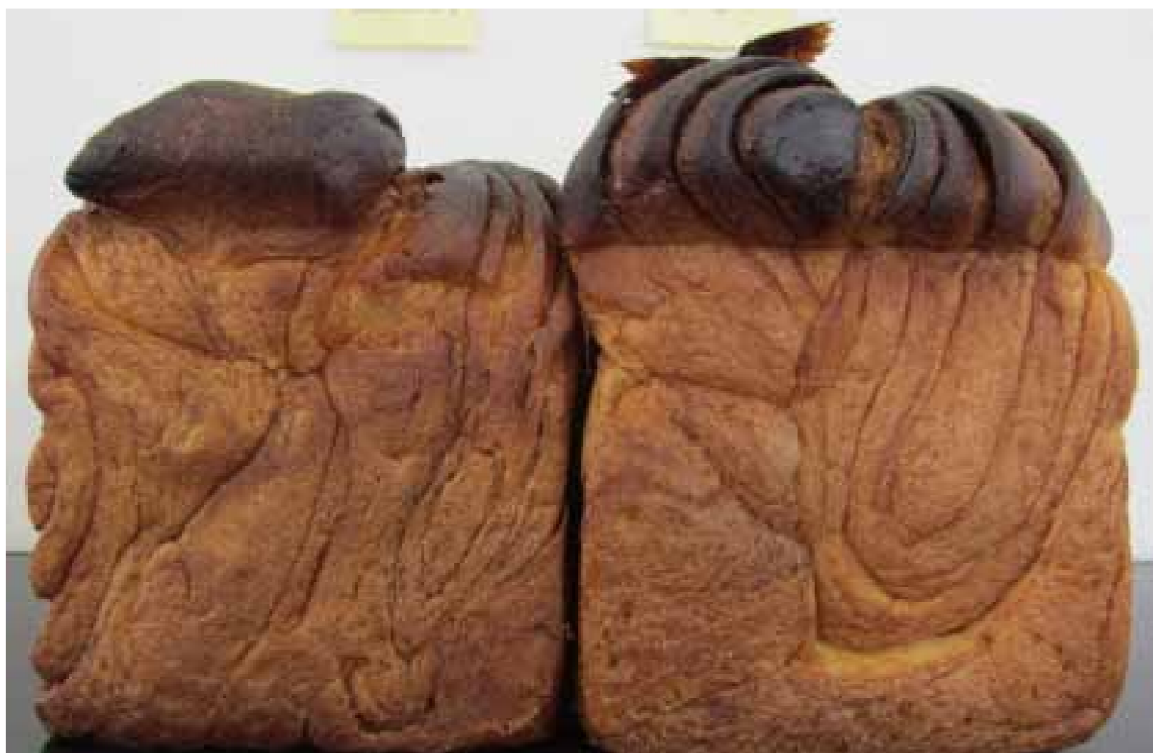
コントロール デナビイク RICH